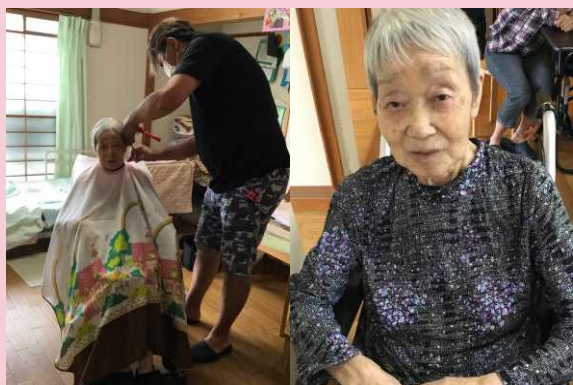
「似合ってるかしら？」と聞く K・T様