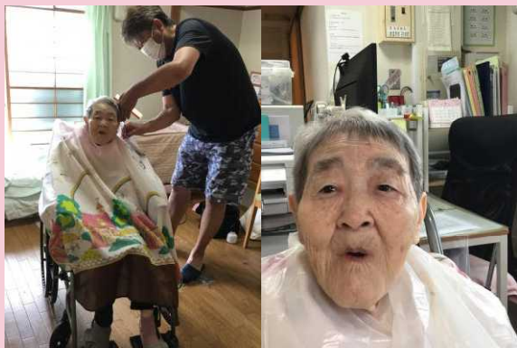
「さっぱりしました！」とお話する A・Y様