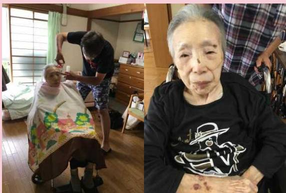
綺麗になって上機嫌な M・F様