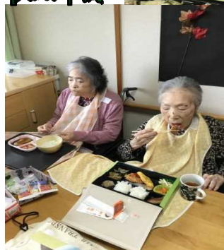
M様・H様はご飯・おかずを味わいながら、「美味しい。」と笑顔で召し上がっておいりました。