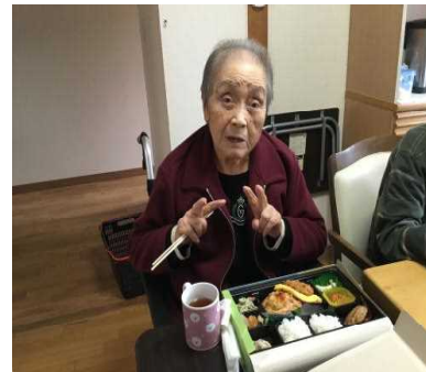
「今日のお弁当は豪華ですね。」とピースしながら話しかけるO様