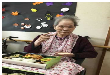
「豪華なお弁当だね。美味しそうだね。」とピースをするT様