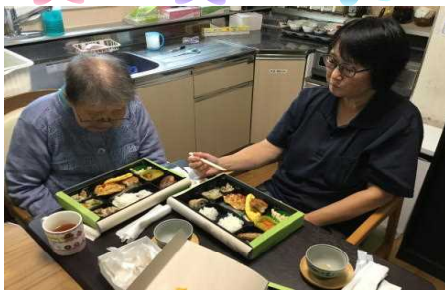
娘さんと楽しく会話をし、何かから食べようか迷われるA様

11/2 (土) お茶の間管理者より、入居者様のご家族様、ケアマネジャーへ「お忙しいところありがとうございます。」等の挨拶より運営会議を行い、その後ホールにて昼食を召し上がっていただきました。ご家族様や利用者様と、笑顔で会話をされながら昼食を召し上がっている、運営懇談会の様子をご覧ください。