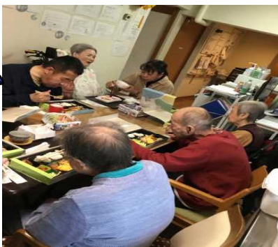
A様・O様・J様・T様は、美味しそうにご飯・おかずを召し上がっておいりました。