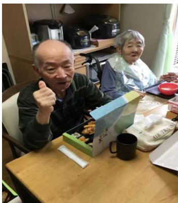
もぐもぐとお弁当を食べ終え、「美味しかったよ。」と話すY様。