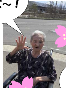
今日は暑いくらい！