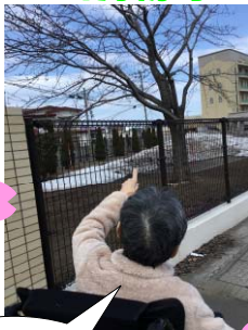
4月初旬の暖かな日

4月は初旬から、暖かい日も多く「雪は解けたか？」 「桜は咲いたか？」と皆様外の様子気になるご様子。 暖かい日には皆様をお散歩へお誘いしました。 中には「今日行ける？」と日課になっている方もおり、 近くの公園へ、桜の様子を見に、コンビニへおやつを買いに、 少しは気分転換になっているようです。 皆で弘前城までドライブして、おいしいもの食べて…といった 行事は難しい状況ですが… 春です！外に飛び出しましょう♪♪♪