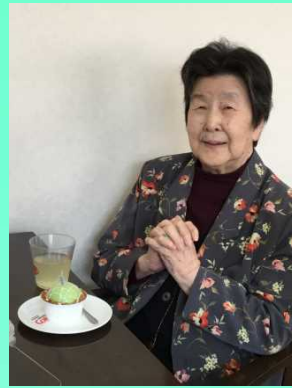
おしゃれなお菓子だね