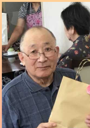
子供達は元気かい?