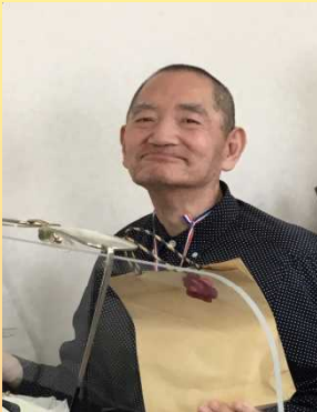
ありがとうございます