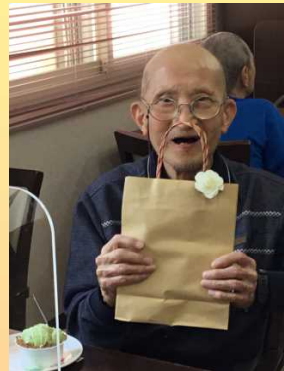
ケーキも美味しいです