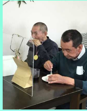
おかわりお願いします