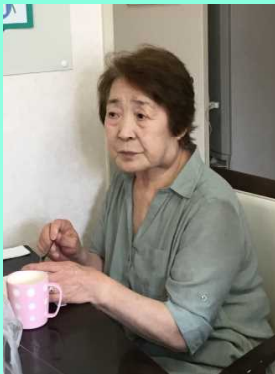
母ですが食べます