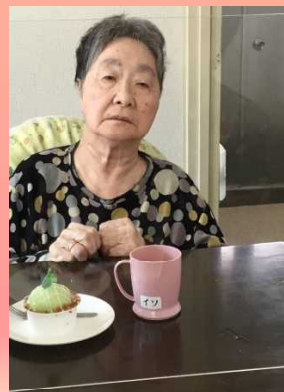
かわいいお菓子なこと