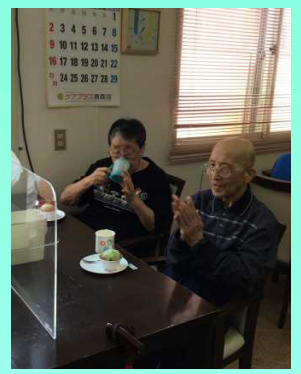
若く明るい歌声に〜♪