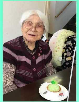
黒飴より美味しい