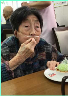
父にも食べさせたい