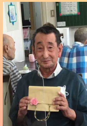
これはうれしいね