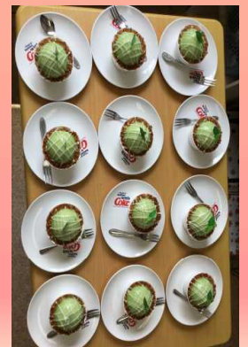
ささやかですがどうぞ